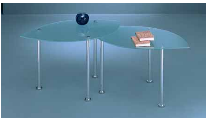
z.B. Beistelltische ↑ Profil: 25 mm, Silber Glanz. Satinieretes Glas

e.g. Shelf unit with console, Profile: 25 mm, shiny silver