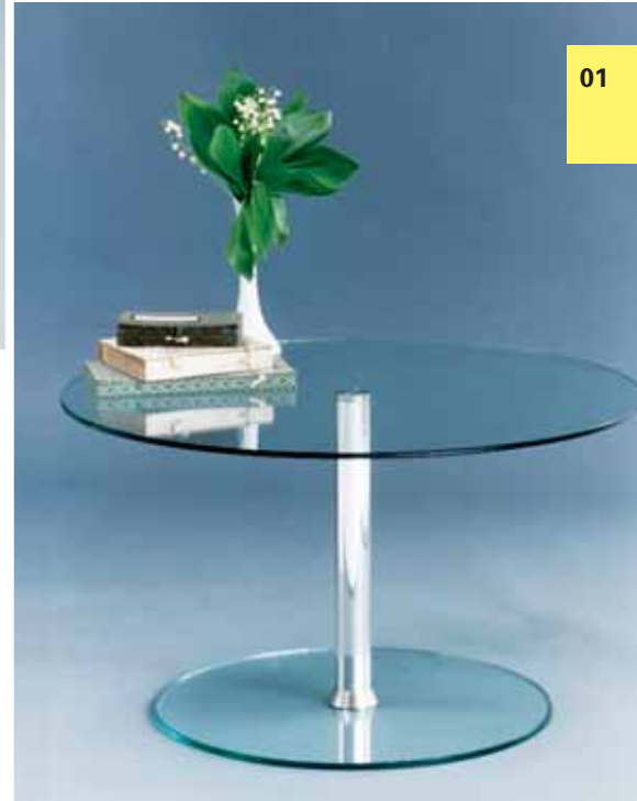
e.g. Occasional tables Profile: 50 mm, shiny silver. Dull glass.