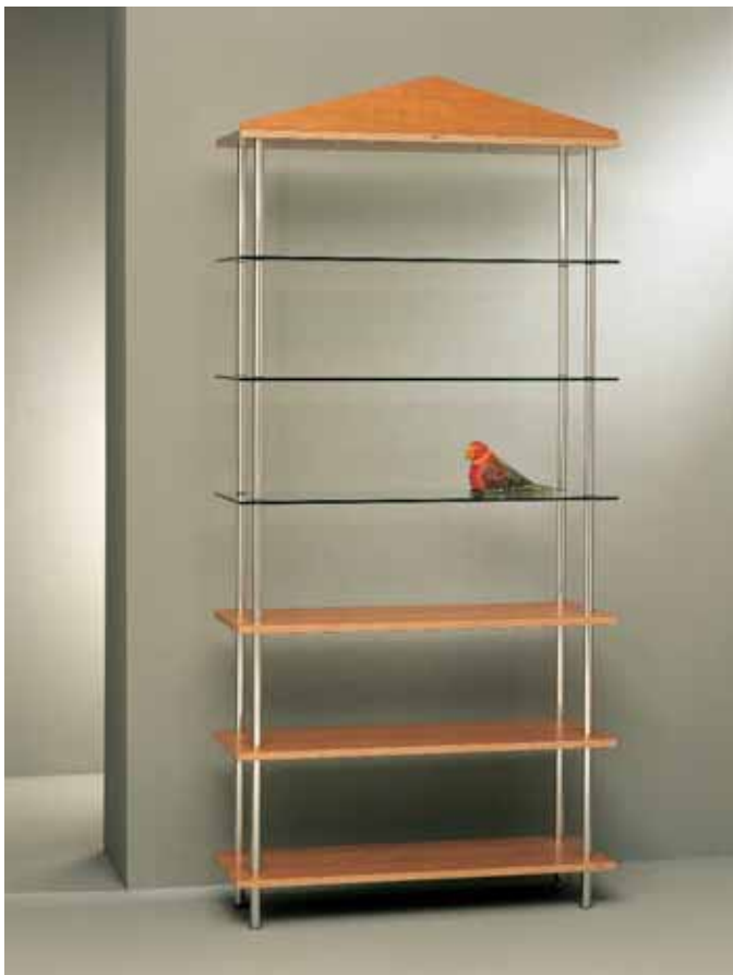
← z.B. Regal Profil: 25 mm, Silber Glanz. Fachböden: klares Glas und Holz.