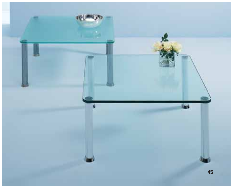
e.g. Occasional tables Profile: 50 mm, stain- less steel and shiny sil- ver. Dull and plain glass.