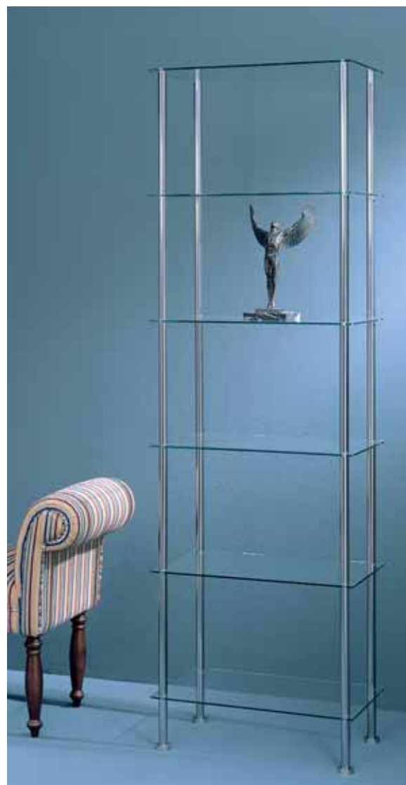
z.B. Regal ↑ Profil: 25 mm, Edelstahl. Fachböden: klares Glas.