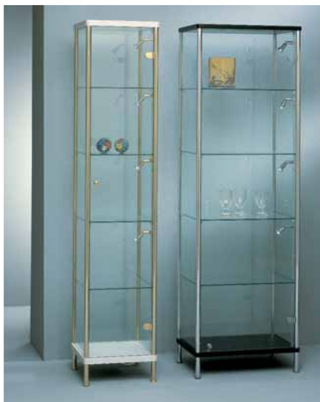
z.B. Vitrinenschrank → 1-türig, mit gebogenen Seiten Profil: 25 mm, Gold Glanz.

e.g. Vitrine for wall-mounting (1 door) Profile: 25 mm, shiny silver.