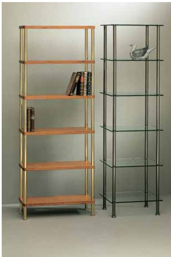
z.B. Regal → Profil: 25 mm, Gold Glanz und Edelstahl. Fachböden: Holz und klares Glas.