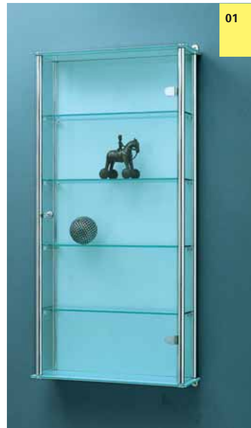
z.B. Flache Wand- vitrine, 1-türig → Profil: 25 mm, Silber Glanz.

e.g. Vitrines (1 door) Profile: 25 mm, shiny gold, shiny silver. Illumi- nated.