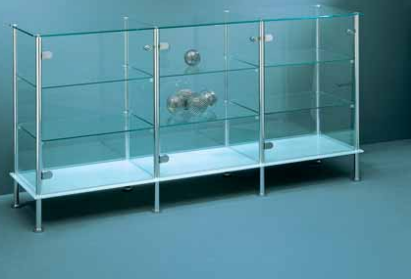
← z.B. Thekenschrank, 3-türig Profil: 25 mm, Silber Glanz.

e.g. Counter vitrine (3 doors) Profile: 25 mm, shiny silver.