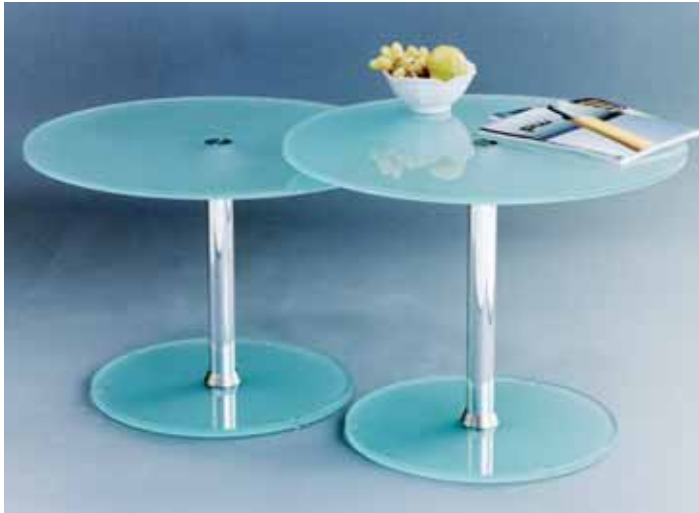
z.B. Beistelltische ↑ Profil: 50 mm, Silber Glanz. Satiniertes Glas