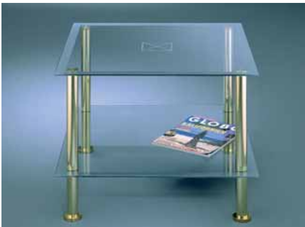
z.B. Beistelltisch ↑ Profil: 35 mm, Gold Glanz. Fachböden: klares Glas.